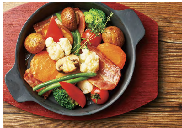
オリーブオイルで ローストした野菜のサラダ ¥800

アレルギー：乳成分・小麦 Food allergens: Milk, Wheat