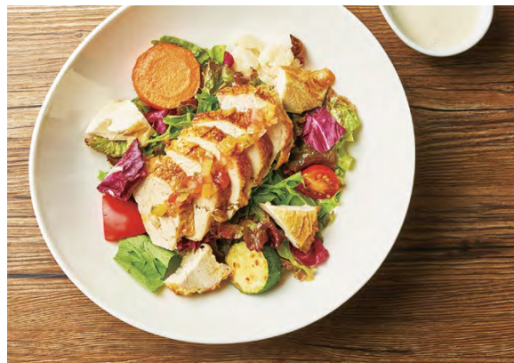
ロティサリーチキン サラダ

アレルギー：乳成分・小麦 Food allergens: Milk, Wheat