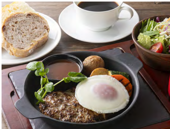
ハンバーグ&フライドエッグ デミグラスソース

Hamburg steak & fried egg with original demi-glass sauce