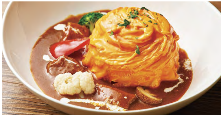
蘭王のビーフシチューオムライス ¥2,200