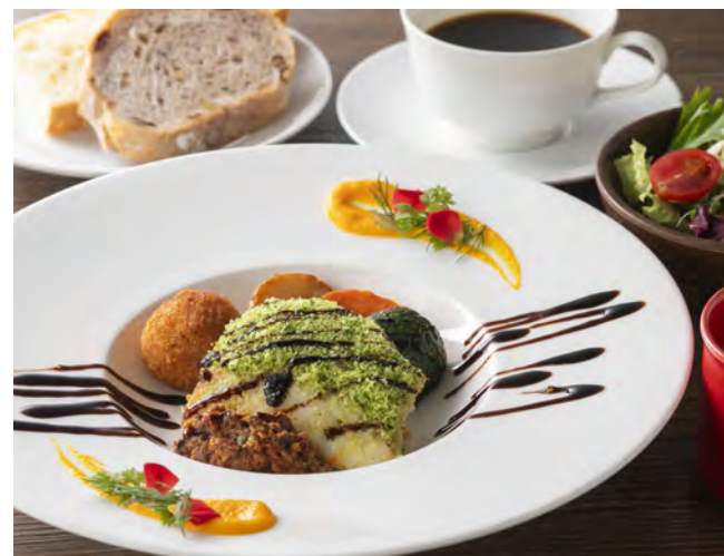
魚のオーブン焼き