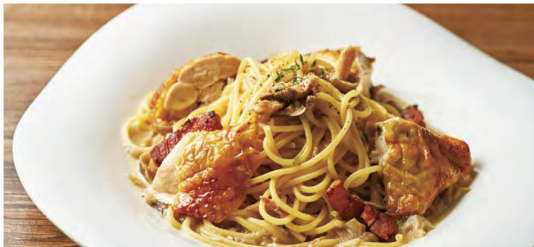
ロティサリーチキンとポルチーニ茸の クリームパスタ ¥1,300

Cream pasta with rotisserie chicken & porcini mushrooms