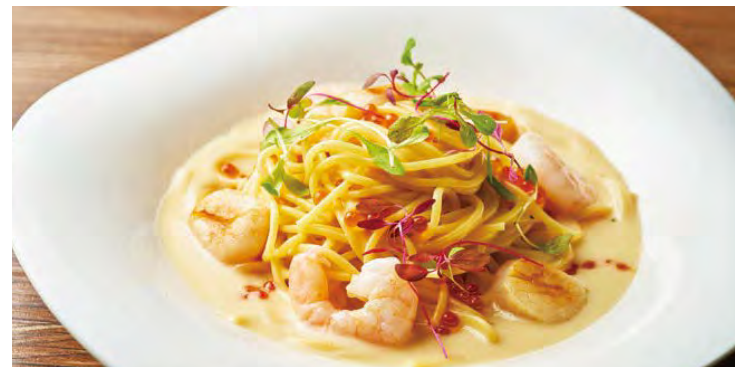
小海老と帆立貝柱のチーズパスタ ¥1,300

アレルギー：卵・乳成分・小麦 Food allergens: Egg, Milk, Wheat