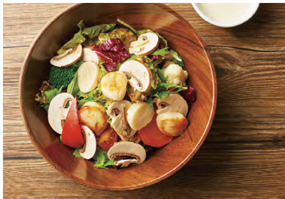
帆立貝柱と マッシュルームのサラダ