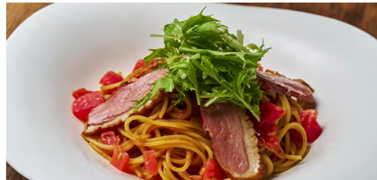
合鴨スモークのトマトソースパスタ ¥1,300

アレルギー：卵・乳成分・小麦 Food allergens: Egg, Milk, Wheat