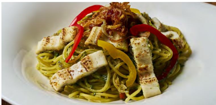
焼きアナゴとパプリカの大葉ジェノベーゼパスタ ¥1,300

アレルギー：卵・乳成分・小麦 Food allergens: Egg, Milk, Wheat