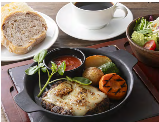
モッツアレラチーズハンバーグ ソースポモドーロ

Mozzarella cheese hamburger steak with tomato sauce