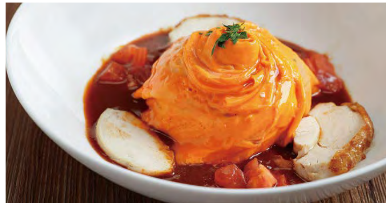
蘭王のオムライス

アレルギー：卵・乳成分・小麦 Food allergens: Egg, Milk, Wheat