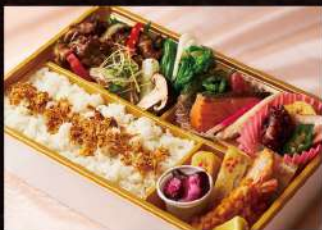
国産牛肉と香味野菜の 焼肉御膳 特製おろし野菜のソース ¥2,500

ご予約は WEBにて2日前まで承ります。 (当日予約及び電話予約サービスは 終了いたしました)