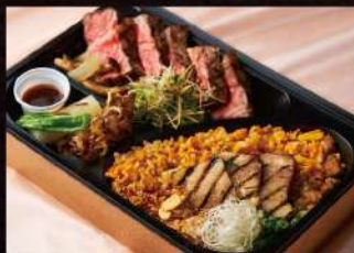
霜降り国産牛サーロインステーキ& チャーシュー入りガーリックピラフ ¥4,000