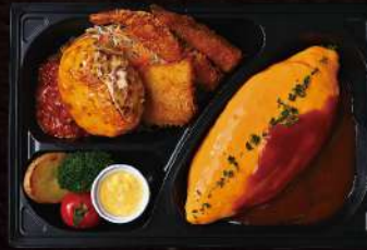
職王さまで作ったホテル特製オムライス& 神戸牛入り手ごねチーズハンバーグ ¥1,250