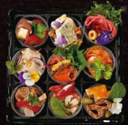
オードブル盛合わせ (2名様分) ¥2,200